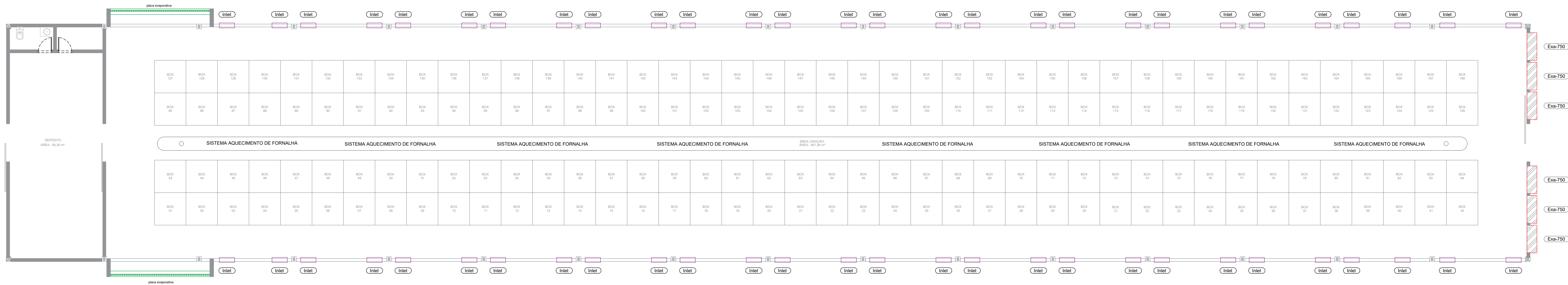
PLANTA BAIXA 1/75